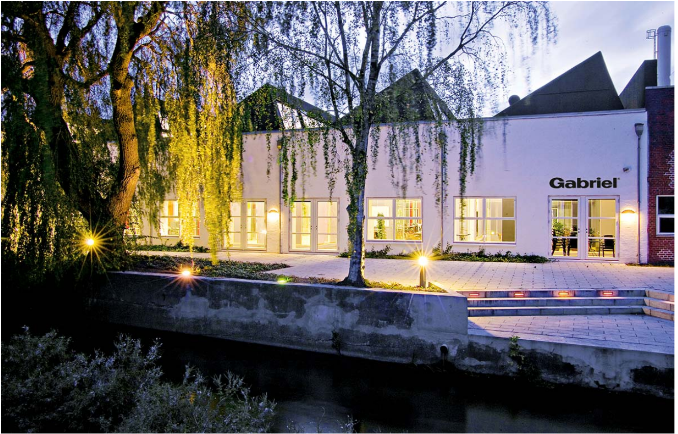
Headquarter Aalborg, Gabriel

Le innovazioni in campo biometrico consentono una riduzione dei costi in cambio dell'accesso privilegiato ai nostri dati