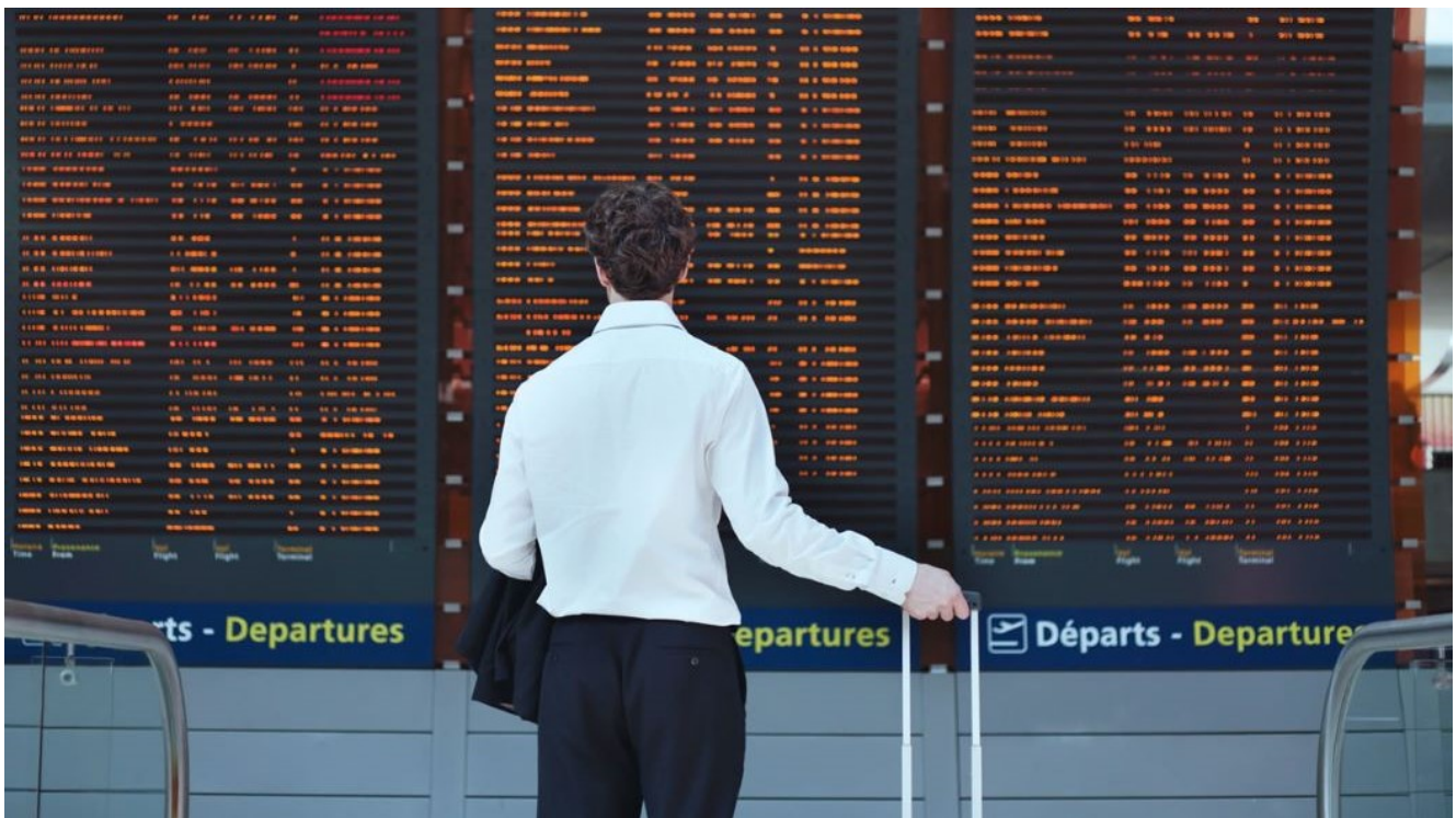
Un passeggero guarda il tabellone delle partenze in aeroporto

Con l'internet of things sarà possibile un servizio sempre più personalizzato muovendosi nella struttura fisica. Il 54% degli aeroporti invierà notifiche in app sui tempi d'attesa per il volo e il 77% investirà in strumenti per la navigazione indoor entro il 2022. Un esempio? Dal primo quadrimestre del 2020 sarà disponibile a Malpensa (nel T1) la tecnologia beacon con connessione bluetooth: entrando in aeroporto, l'App Sea Milan Airports indicherà il volo e guiderà i passeggeri al gate indicando il percorso più breve, arricchendolo di informazioni sui servizi (ascensori, scale mobili, farmacie, shopping).