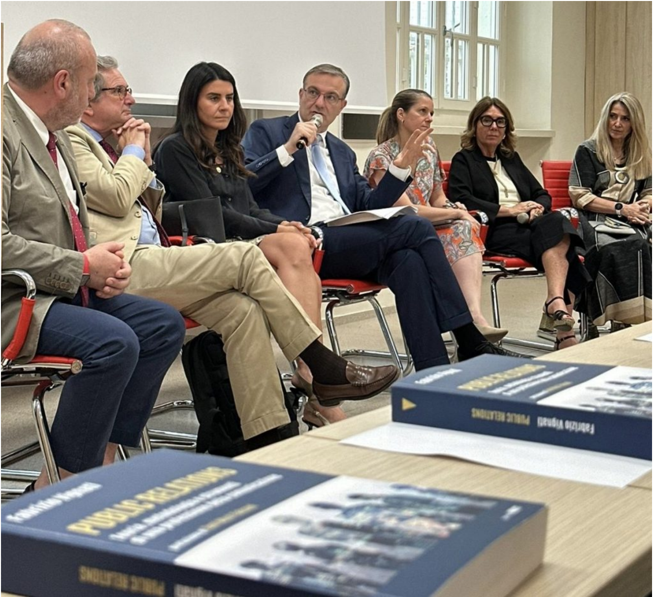
Autore di Public relations. Teoria, metodologia e strumenti di una professione della comunicazione